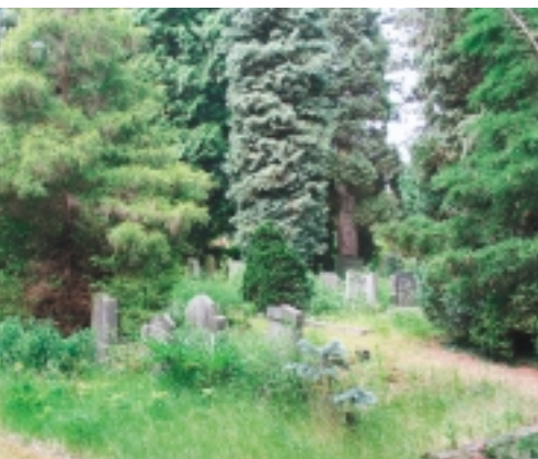
Gesloten begraafplaatsen, of delen daarvan, leveren vaak een romantisch beeld op ten aanzien van het groen, maar de funeraire waarden raken letterlijk overwoekerd door gebrek aan onderhoud. Algemene Westerbegraafplaats te Enschede

Uit het voorgaande zou men de conclusie kunnen trekken dat op een beschermde begraafplaats een begrafenis of plaatsing van een grafmonument al zou kunnen leiden tot het moeten aanvragen van een vergunning. Dit kan echter niet de bedoeling zijn. Daarom is in de wet een artikel opgenomen waarin wordt gesteld dat bij toepassing van de wet rekening wordt gehouden met het gebruik van het monument. Aangezien begraven inherent is aan het gebruik